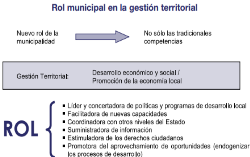
Figura No. 4: Rol municipal en la gestión territorial

El municipio como cédula de la nación cumple un rol para el desarrollo económico, por ello la importancia de que se mantenga viva y productiva en beneficio de la sociedad, como se ve en la Figura No. 4.