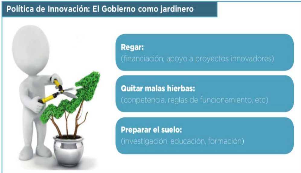
Figura No. 5: Política de innovación