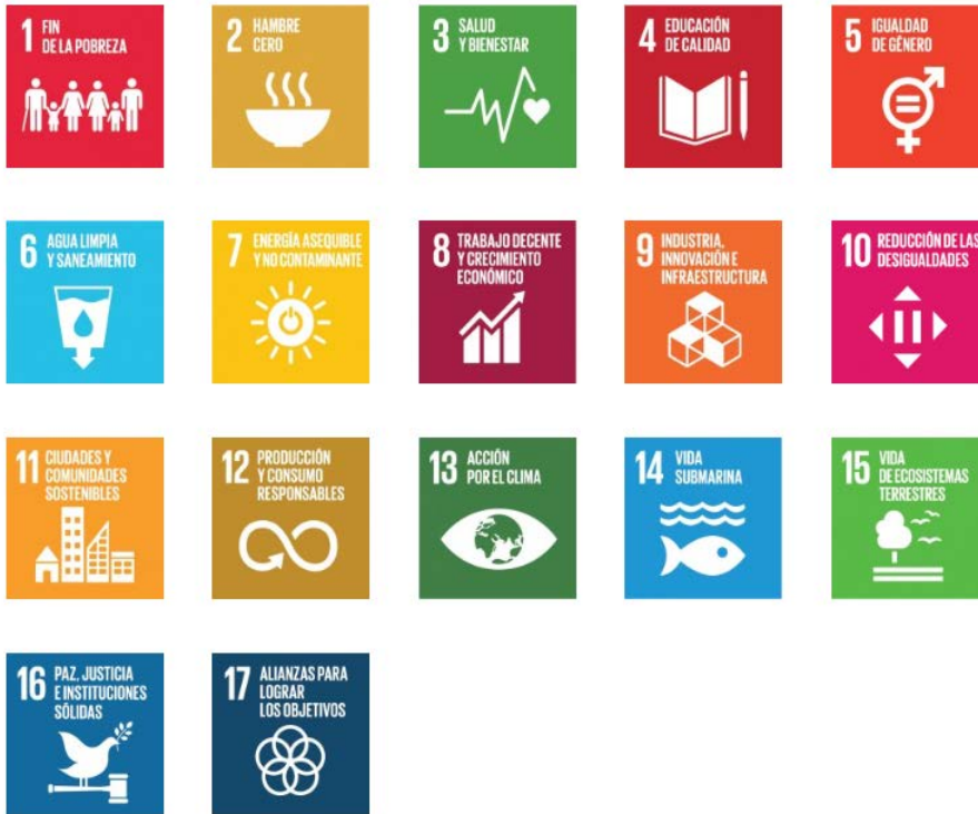
Figura No. 3: Objetivos del desarrollo sostenible